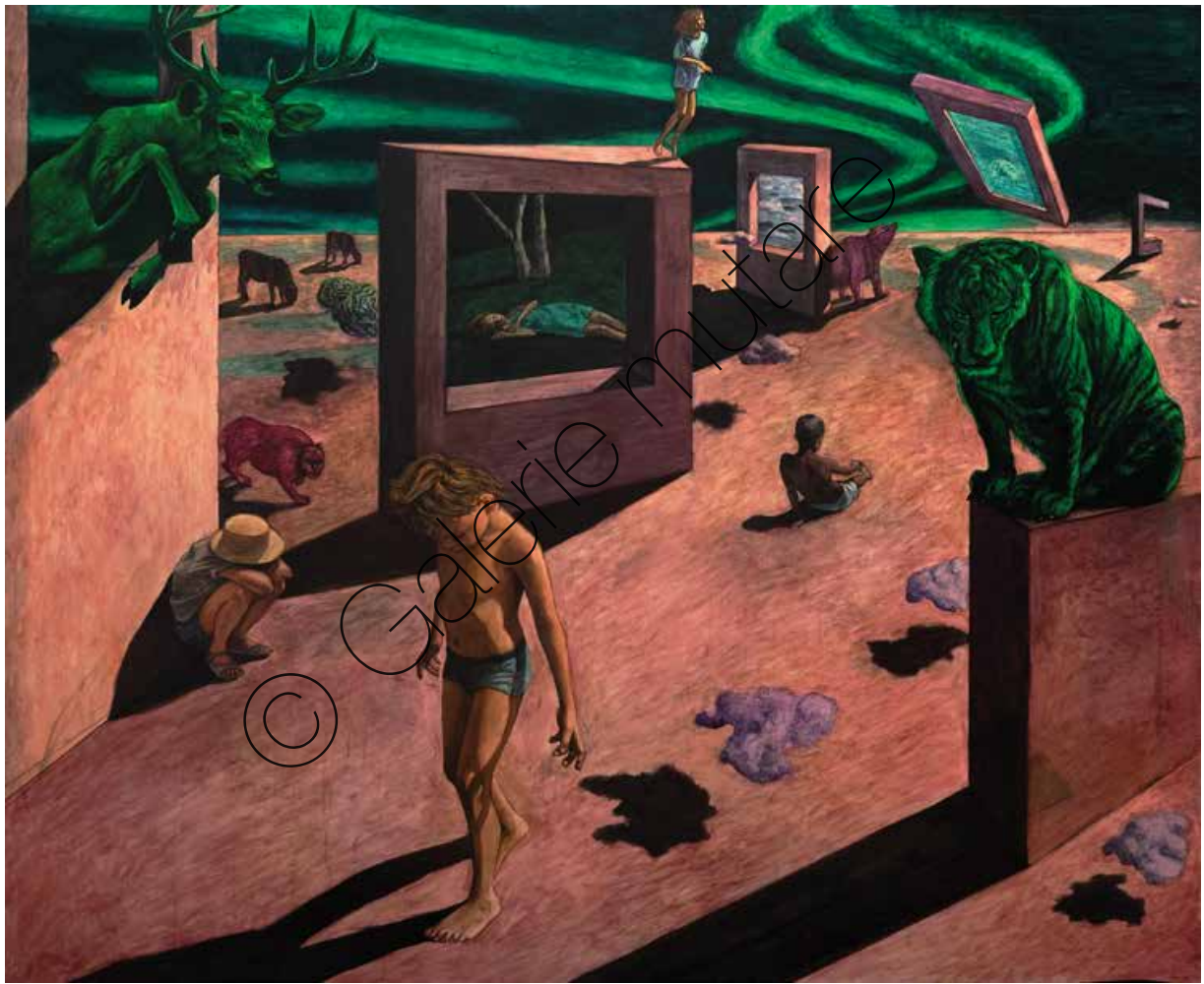
Bruno's Dream IV | Öl/Lw (Oil on canvas) | 180 x 220 cm | 2021 | 16.000 €