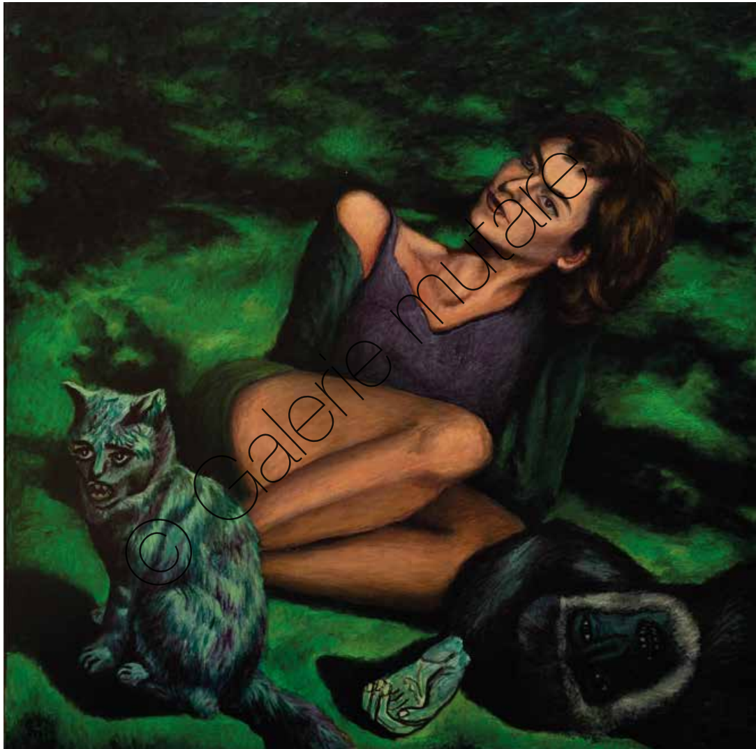
Pandemie (Pandemic) | Öl/Lw (Oil on canvas) | 120 x 120 cm | 2020 | 8.000 €