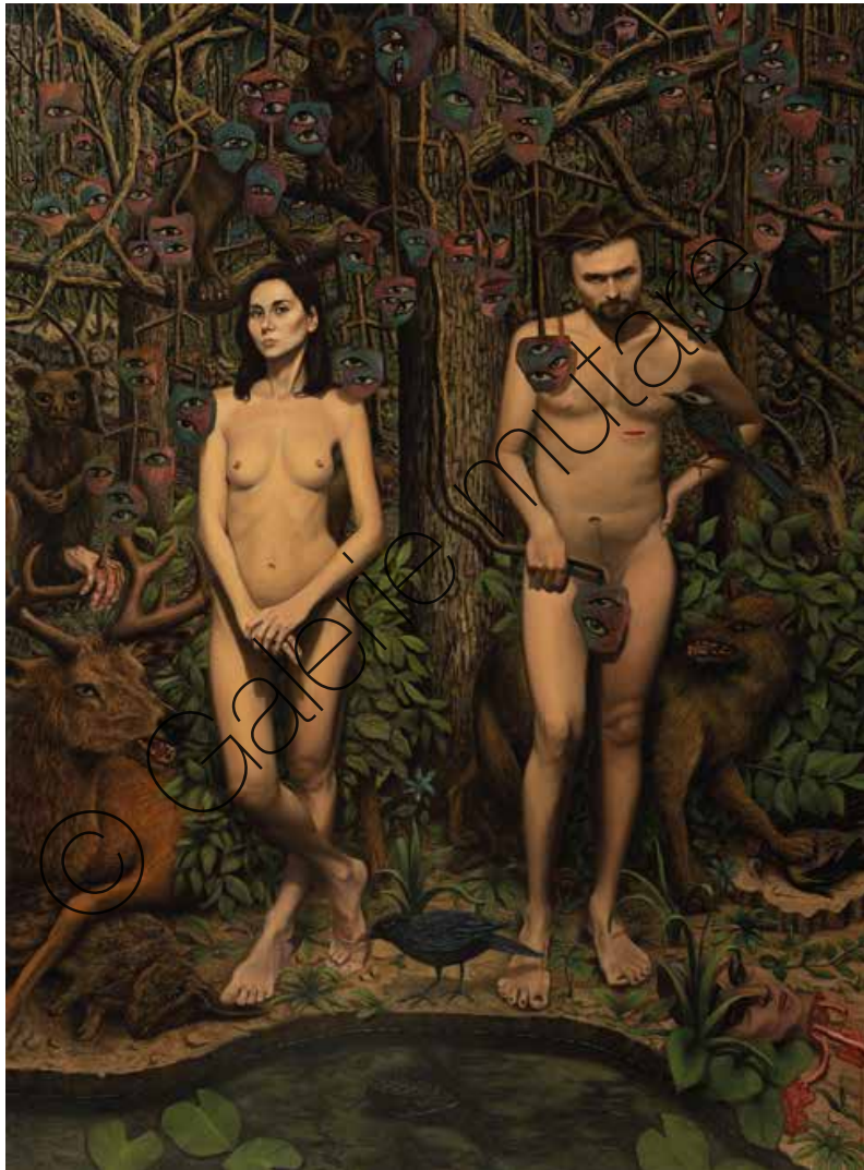
Adam & Eva | Öl/Lw (Oil on canvas) | 230 x 170 cm | 1999 | 20.000 €