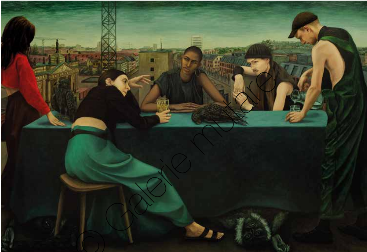
Abend über Potsdam (Evening over Potsdam) | Öl/Lw (Oil on canvas) | 150 x 270 cm | 2021 | 16.000,- €