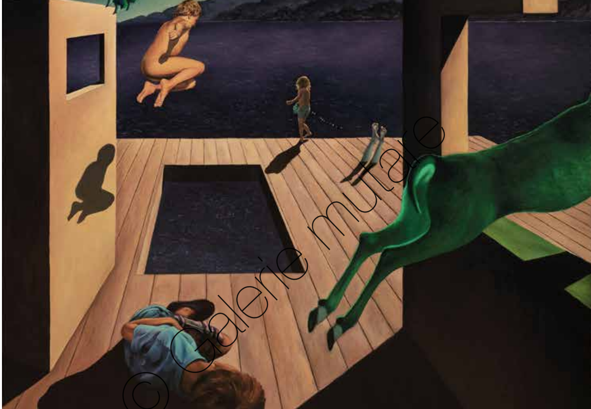
Bruno's Dream II | Öl/Lw (Oil on canvas) | 200 x 153 cm | 2021 | 14.000 €