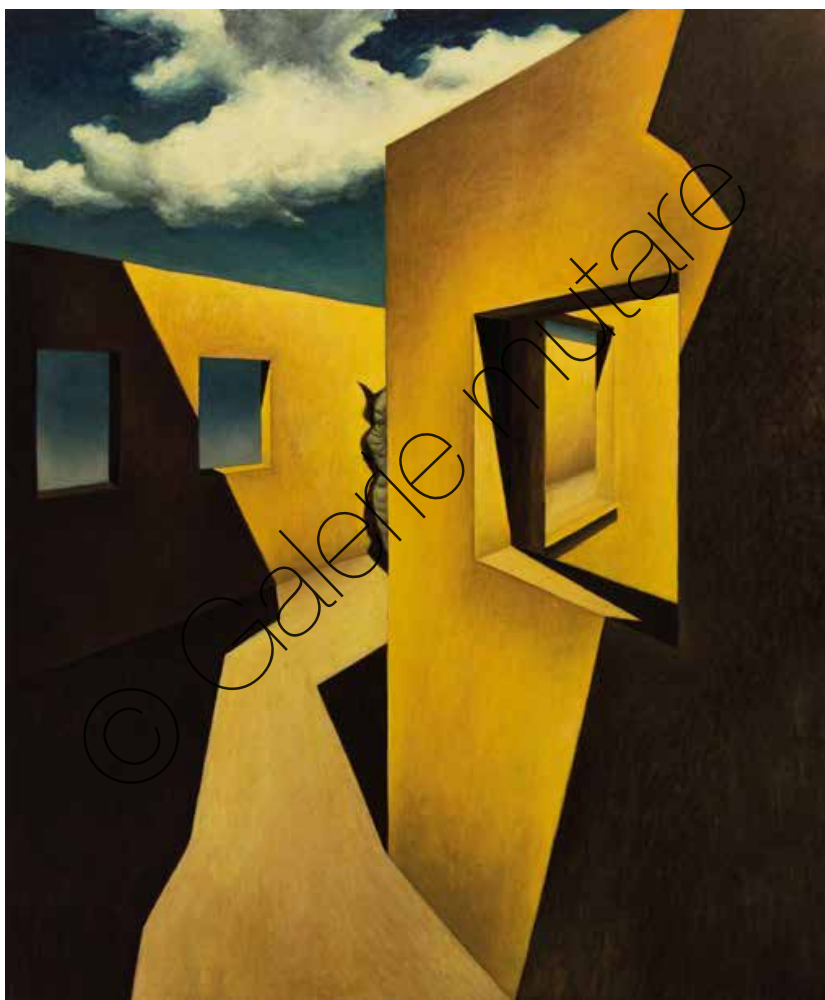
Life is Elsewhere | ÖL/Lw (Oil on canvas) | 180 x 150 cm | 2017 | 11.500 €