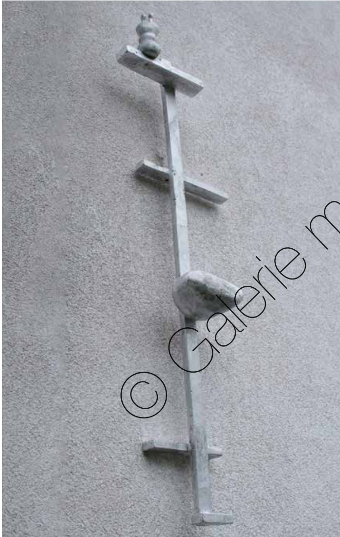
Spirituelle Aufstieg (Spiritual Ascension) | Aluminium (Aluminium) 130 x 38 x 18 cm | 2023 | Auflage 2 (Edition 2) | 1.300 €