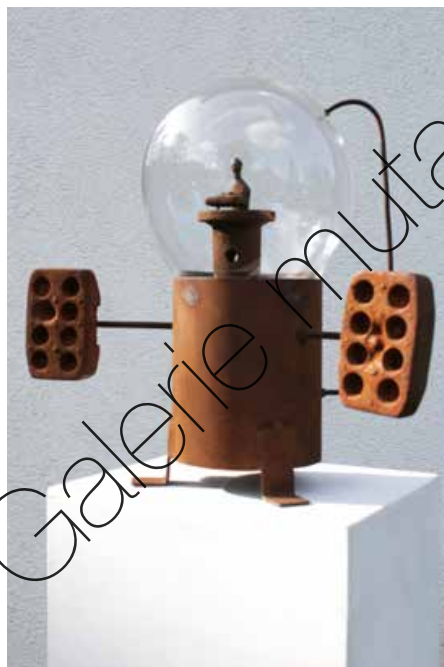
Meister der Zeremonie (Master of Ceremony) Eisen, Glas (Iron, glass) 43 x 50 x 24 cm | 2023 | 3.500 €