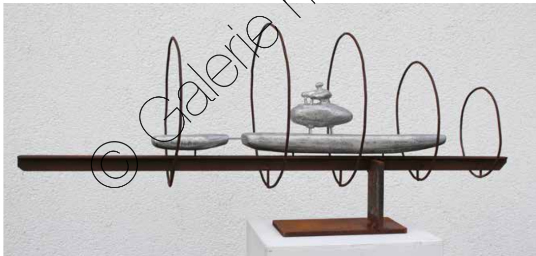
Station (Station) | Beton, Draht (Concrete, wire) | 28 x 76 x 29 cm | 2016 | 2.500 €