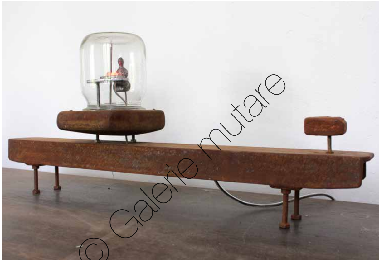
Büro (Office) | Eisen, Glas, Elektronik (iron, glass, electronics) | 28 x 67 x 17 cm | 2015 | 3.000 €