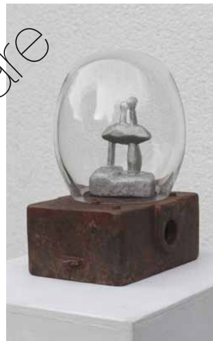
Beginn einer Beziehung (Start of a relationship) Eisen, Glas, Aluminium (Iron, glass, aluminum) 25 x 20 x 15 cm | 2023 | 1.000 €