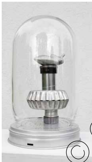
Privat (Private) Glas, Aluminium (Glass, aluminum) 36 x 21 x 21 cm | 2023 | 2.000 €