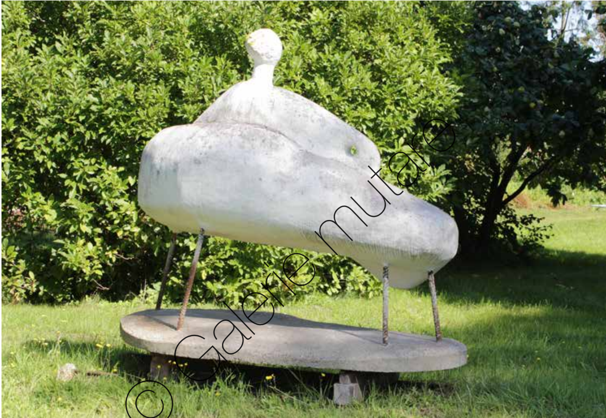
Sofa (Sofa) | Beton, Stahl (Concrete, steel) | 1,7 x 2,0 x 1,1 m | 2014 | 8.000 €