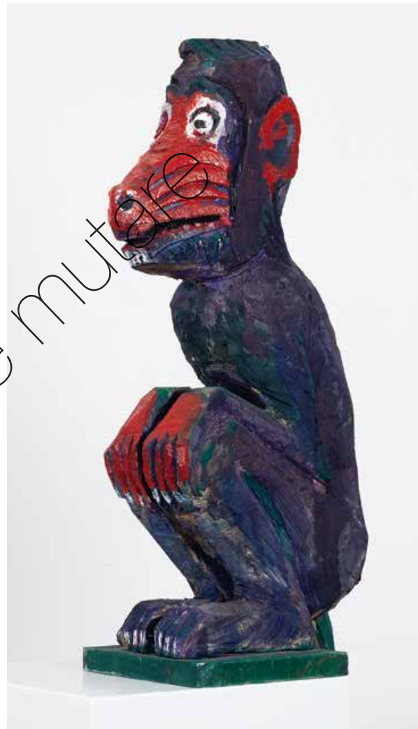
Assistent (Assistant) Holz & Farbe (Wood & paint) 60 x 20 x 20 cm | 2015 | 7.200 €