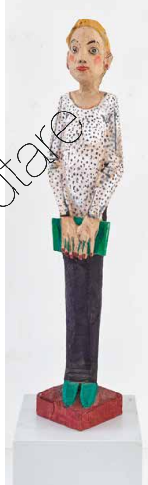
Die Lehrerin (The Teacher) Holz & Farbe (Wood & paint) 100 x 20 x 21 cm | 2013 | 14.300 €