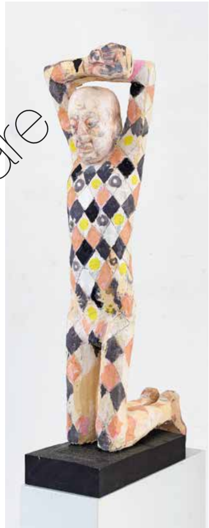
Alternder Clown (Aging Clown) Holz & Farbe (Wood & paint) 95 x 26 x 47 cm | 2021 | 11.900 €