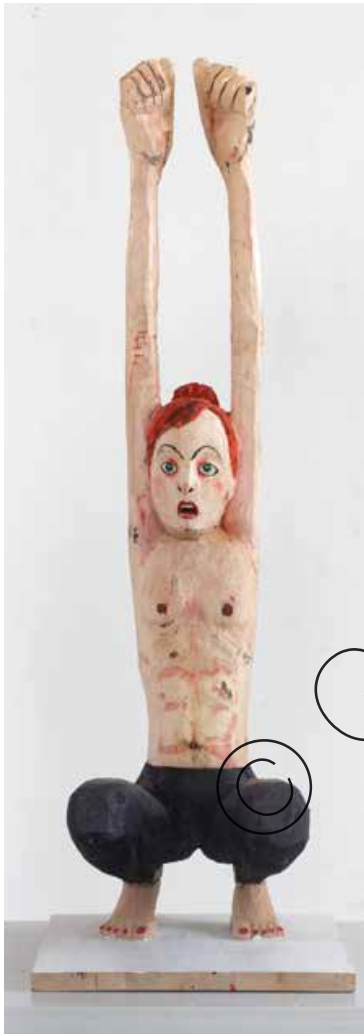
Hands Up (Hands Up) Holz & Farbe (Wood & paint) 124 x 40 x 39,5 cm | 2020 | 14.300 €