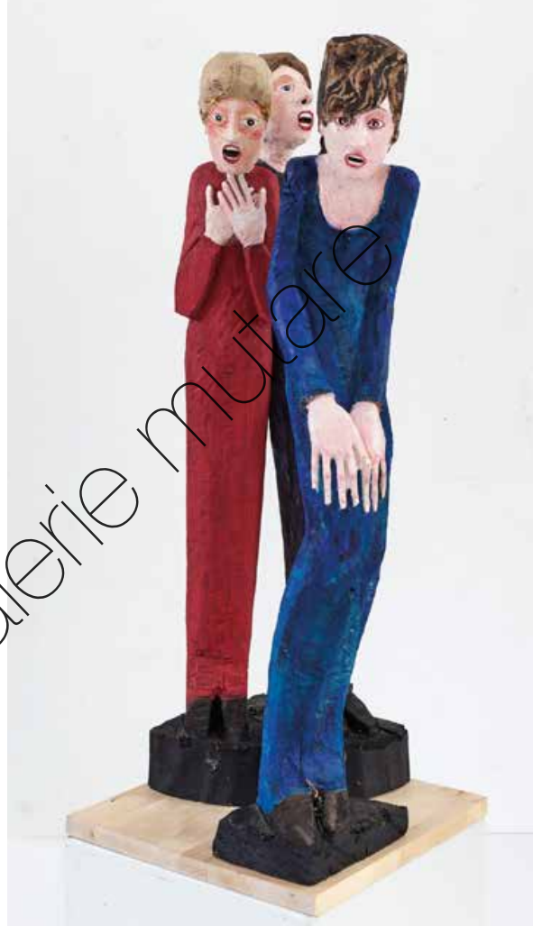
Lamento (Lament) Holz & Farbe (Wood & paint) 102 x 40 x 40 cm | 2020 | 14.300 €