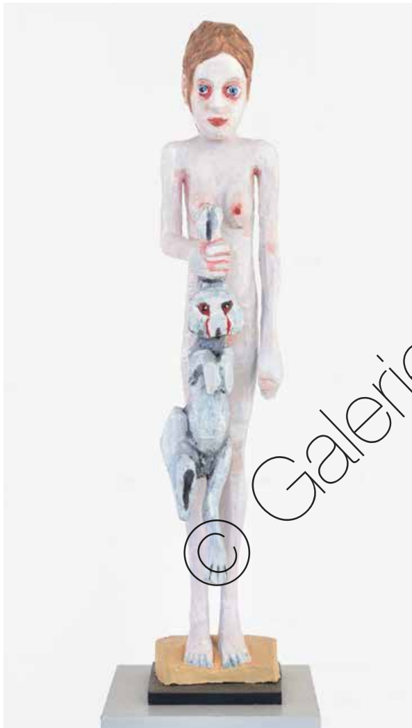
Das Hasenmädchen (The Rabbit Girl) Bronze (Bronze) 97 x 19 x 25 cm | 2021 | 11.900 €