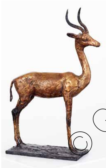
Gazelle „Elvis“ (Gazelle „Elvis“) Bronze (Bronze) | 34 x 9 x 24 cm 2020 | 5.400 €