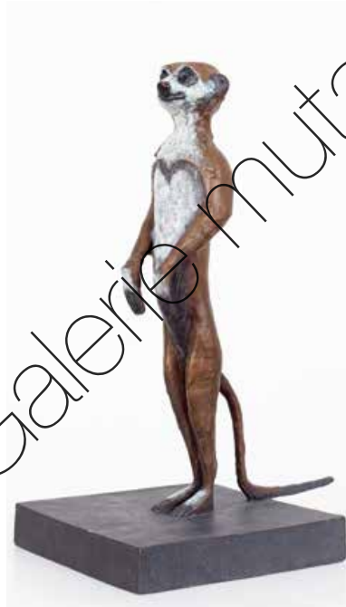
Erdmännchen (Meerkat) Bronze (Bronze) | 30 x 14 x 20 cm 2010 | 4.300 €