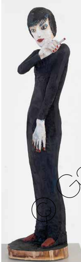
Lotte Lenya 1 (Lotte Lenya 1) Holz & Farbe (Wood & paint) 87 x 22 x 21 cm | 2020 | 11.900 €