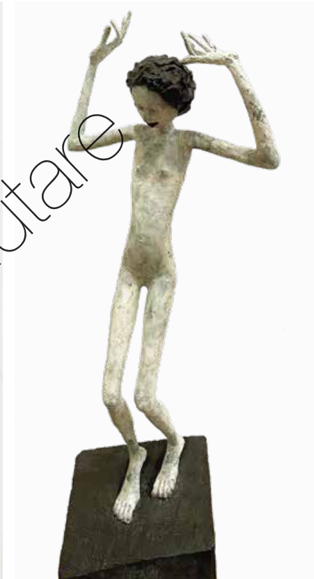
Vergnügen [weiß wie Schnee, rot wie Blut] (Pleasure [White as Snow, Red as Blood]) Bronze (Bronze) | 66,5 x 24 x 14 cm 2010 | 10.800 €