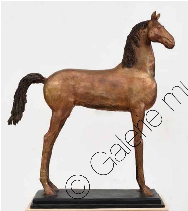
Achal Tekkiner (Achal Tekkiner) Bronze (Bronze) | 85 x 39 x 16,5 cm 2021 | 11.900 €