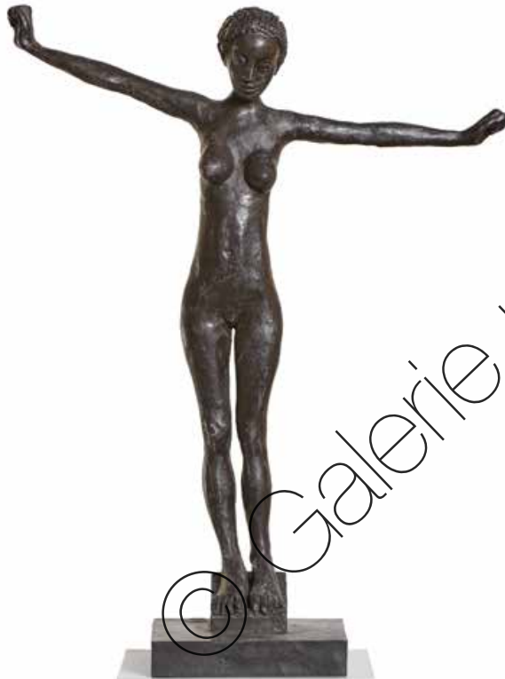
Abheben (Take Off) Bronze (Bronze) 48 x 37 x 14 cm | 2018 | 5.400 €