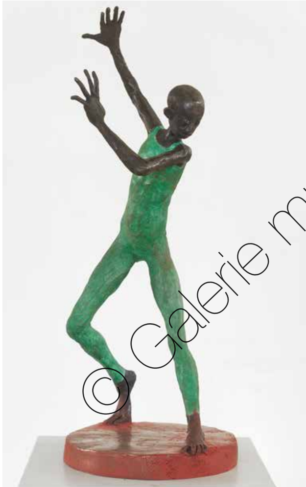
Tänzer [Mr. Bojangles] (Dancer [Mr. Bojangles]) Bronze (Bronze) 39 x 14,5 x 15 cm | 2020 | 5.400 €