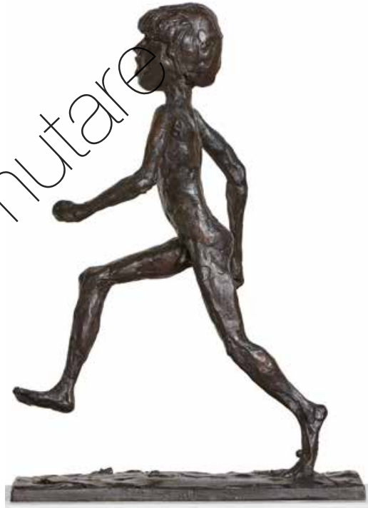
Flitzer (Speedster) Bronze (Bronze) 26 x 9 x 19 cm cm | 2018 | 5.400 €