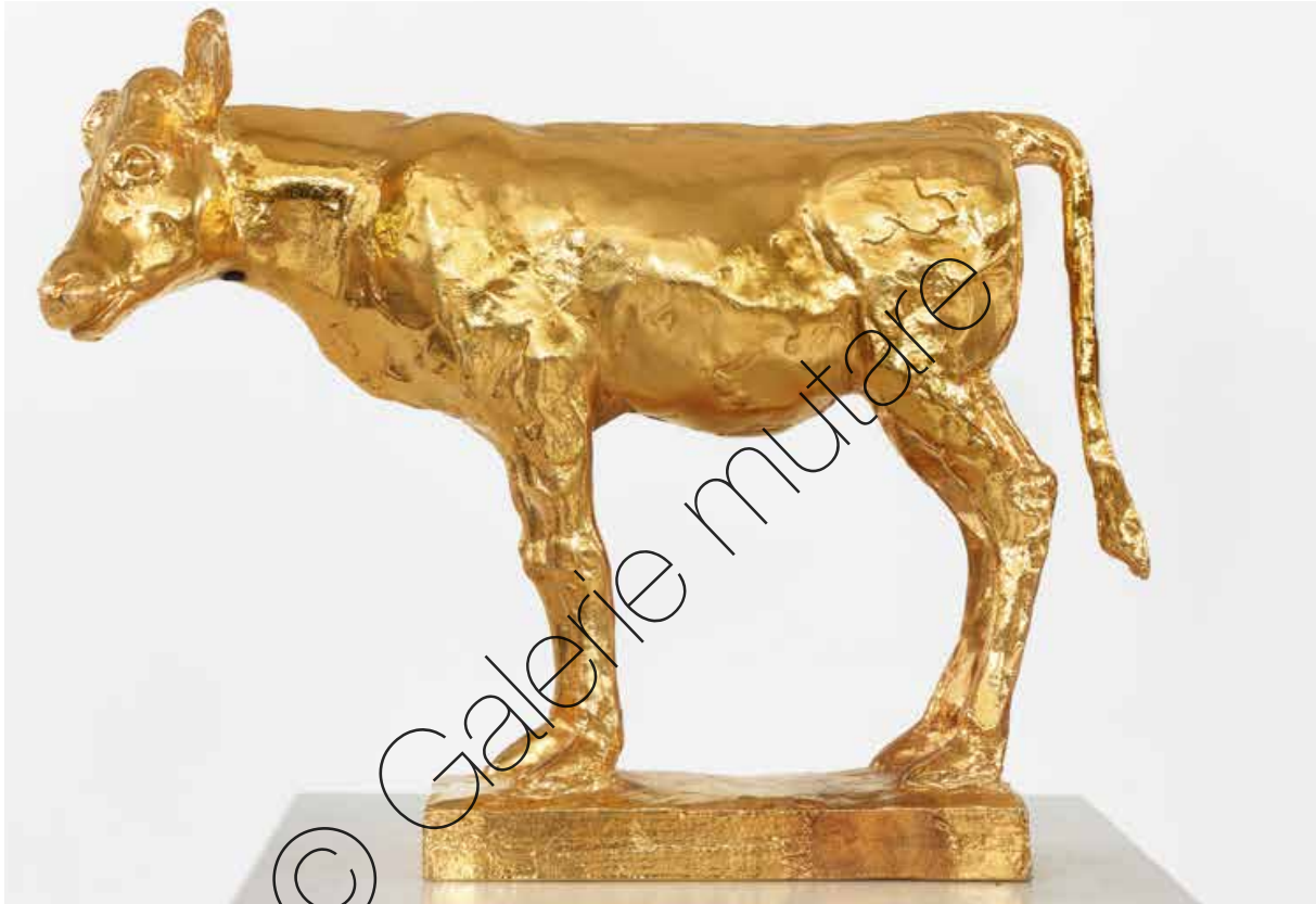
Goldenes Kalb (Golden Calf) | Bronze, vergoldet (Bronze, gold-plated) | 18 x 25 x 8 cm | 2018 | 5.800 €