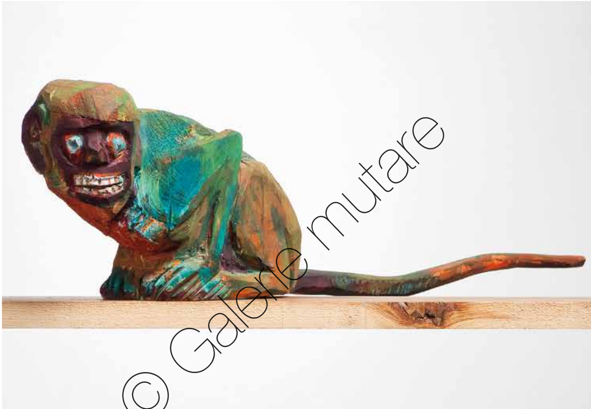
Aufgeschreckt (Startled) | Holz & Farbe (Wood & paint) | 23 x 80 x 14 cm | 2005 | 8.400 €