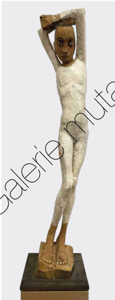
Jonni (Jonni) Holz & Farbe (Wood & paint) 128 x 30 x 30 cm | 2018 | 11.900 €