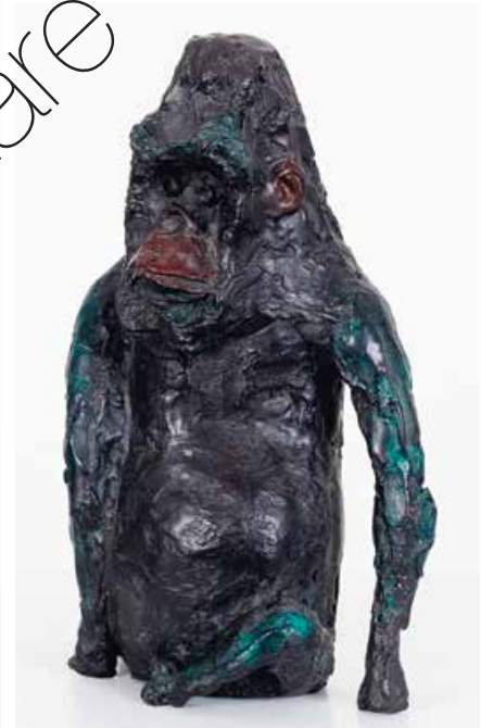
Alpha Tier (Alpha Animal) Bronze (Bronze) | 22 x 15 x 9 cm 2013 | 4.700 €