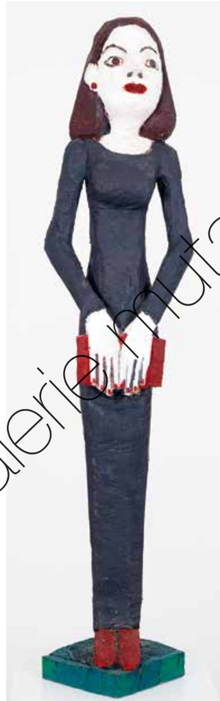
Rendezvous (Rendezvous) Holz & Farbe (Wood & paint) 97 x 22 x 22 cm | 2019 | 11.900 €