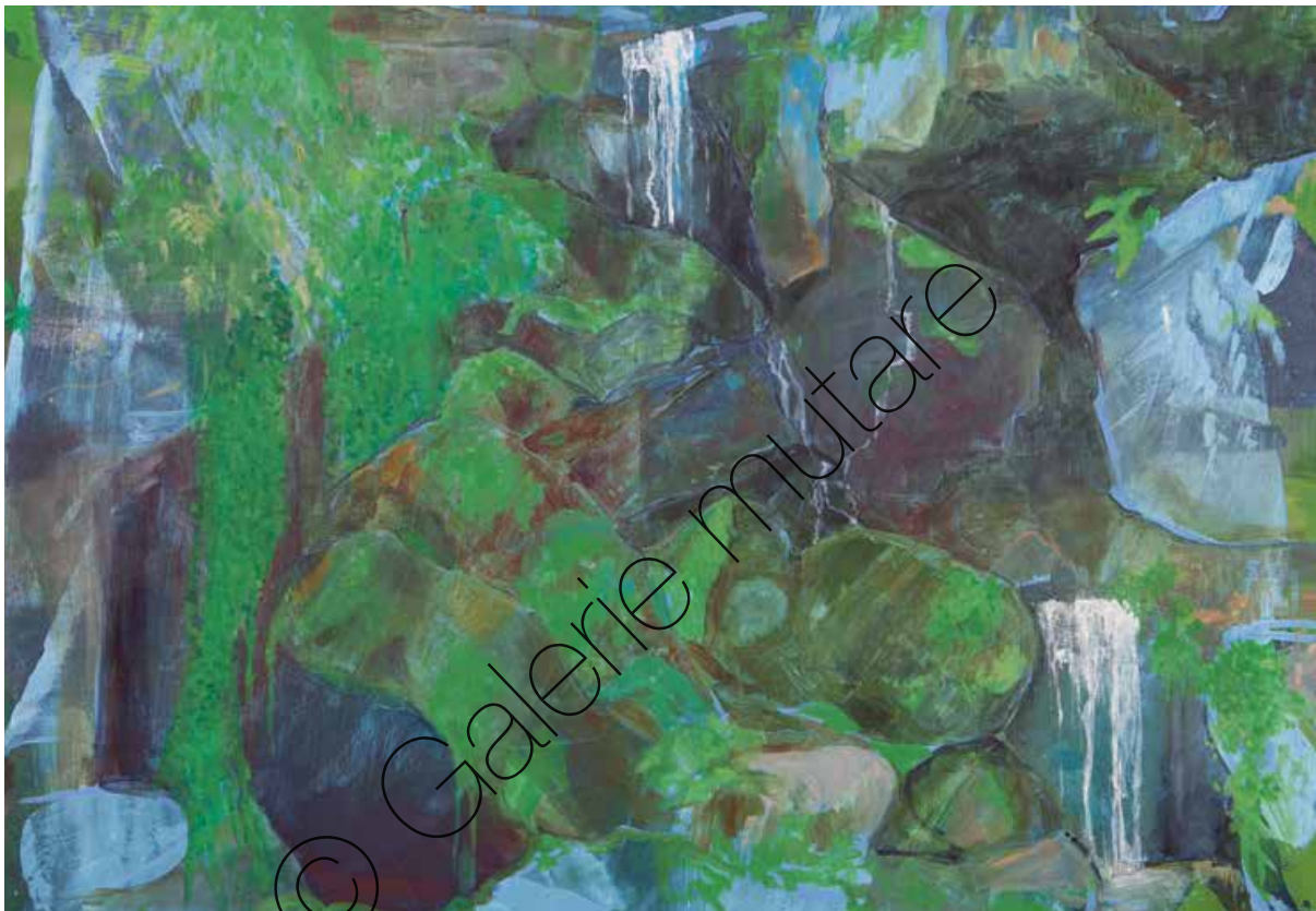
Small Waterfall | Öl/Lw (oil in canvas) | 90 x 80 cm | 2020 | 2.500 €