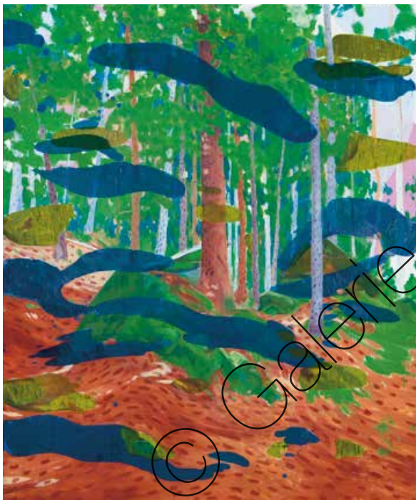
Blue Breeze Öl/Lw (oil on canvas) | 72 x 60 cm | 2021 | 1.200 €