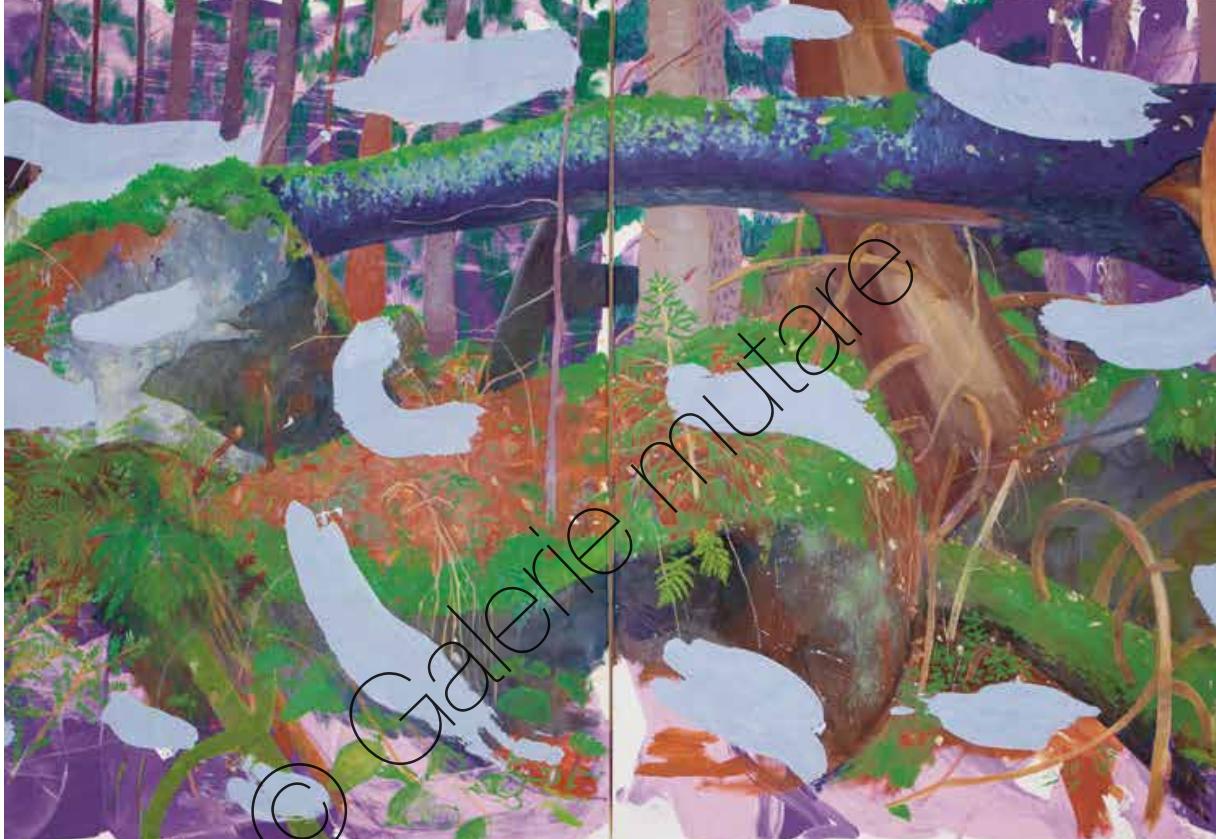
Broken Tree and Stones" | Öl/Lw (oil/canvas) | 120 x 260 cm (2 Leinwände je 120 x 130 cm) | 2 canvases each 120 x 130 cm) | 2021 | 5.100 €