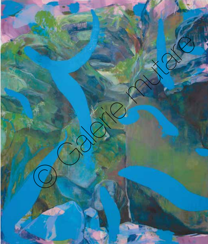
The Cliff Öl/Lw (oil on canvas) | 200 x 170 cm | 2020 | 4.500 €