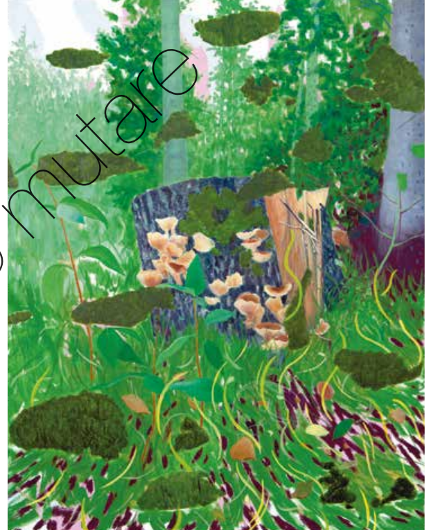
Tree and Mushroom

Öl/Lw (oil on canvas) | 120 x 100 cm | 2021 | 2.600 €