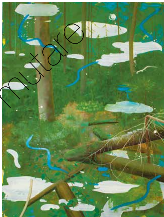
The Trees Öl/Lw (oil on canvas) | 200 x 150 cm | 2020 | 3.800 €