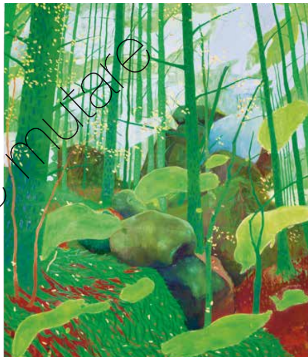
Green Breeze Öl/Lw (oil on canvas) | 140 x 120 cm | 2021 | 2.900 €