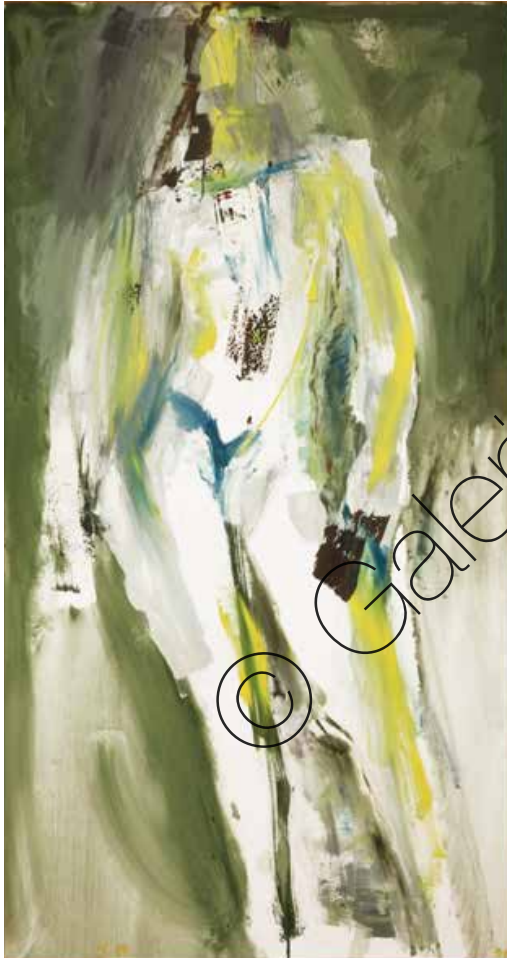
Anna Öl/Lw (Oil on canvas) | 176 x 98 cm | 1991 | 12.000,- €