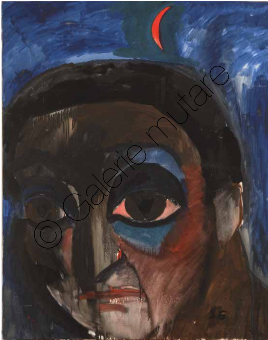
Peppe mit Mond (Peppe with the Moon) | Öl/Lw (Oil on canvas) | 120 x 85 cm | 1999 | 4.000 €