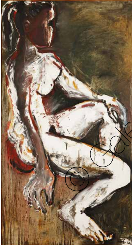
Im Hochsommer (In Midsummer) Öl/Lw (Oil on Canvas) | 175 x 93 cm | 1999 | 12.000,- €