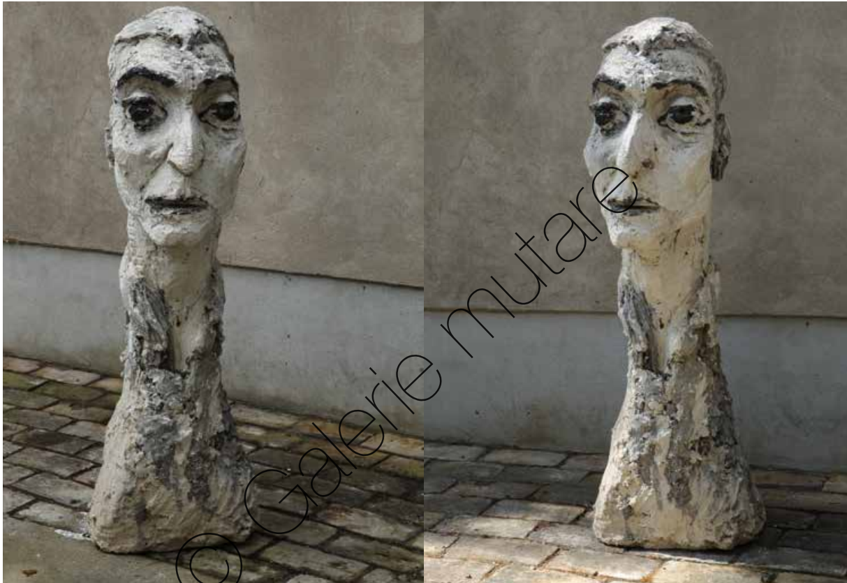
Skulptur (sculpture) Pepe d' Angelo | Vollgips, farbig (chinesische Tusche) | Plaster, coloured (Chinese ink) | H 125 cm | 1991 | Unikat (Unique) | 20.000,- €