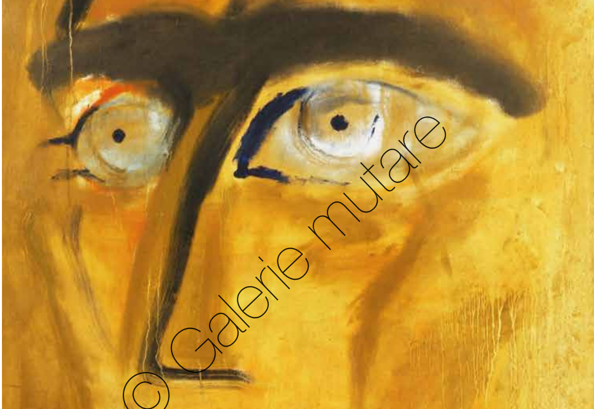
Anton | Öl/Lw (Oil on canvas) | 175 x 93 cm | 1995 | 12.000,- €