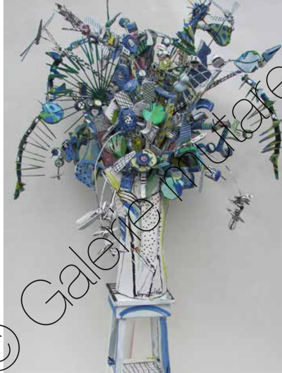
Ersatzwelt (Substitute World) Mischtechnik, vorwiegend Holz (Mixed media, mainly wood) 200 x 115 x 50 cm 2020 - 23 | 6.200 €