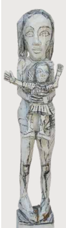
Kleine Schwester (Little Sister) Holz, weiß gefasst (Wood, set in white) Höhe/height 147 cm 2017/18 | 1.600 €