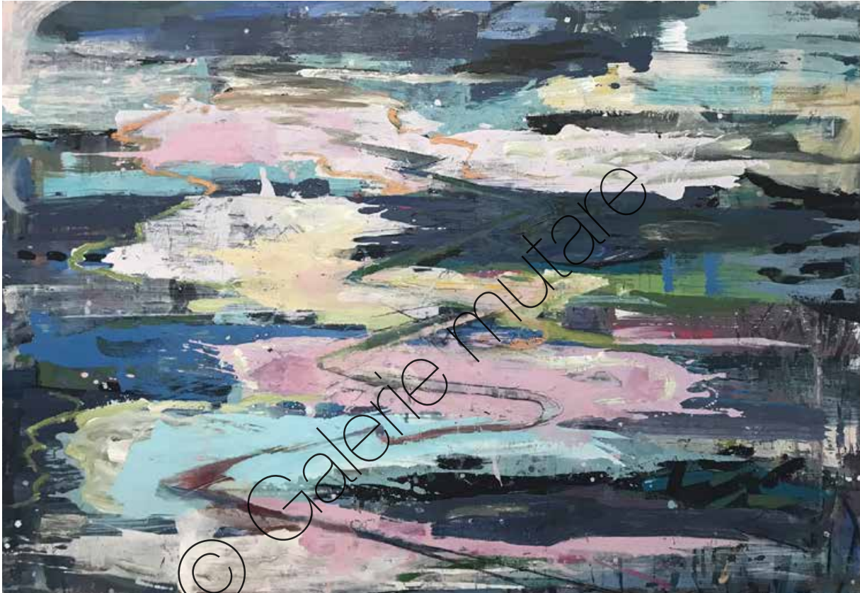
Es schmilzt (It's melting) | Mischtechnik/Lw (Mixed media on canvas) | 144 x 220 cm | 2021 | 8.200 €