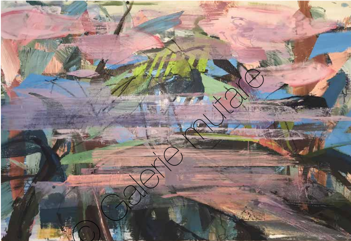
Saharastaub 2 (Sahara Dust 2) | Mischtechnik/Lw (Mixed media on canvas) | 160 x 110 cm | 2022 | 4.100 €