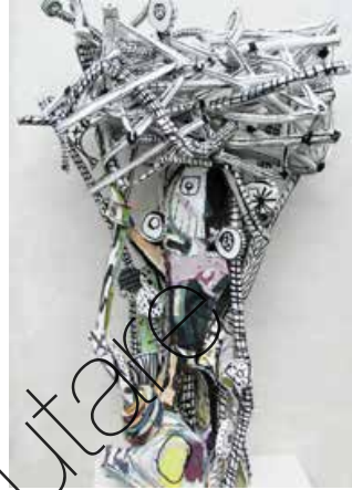
Lastenträgerin (Load Carrier) Holz, farbig gefasst (Wood, coloured) 130 x 60 x 35 cm | 2021 - 22 | 5.200 €