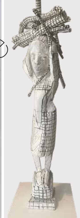
Lastenträgerin Nr. 3 (Load Carrier No. 3) Holz, weiß gefasst (Wood, set in white) 90 x 34 x 21 cm 2023 | 1.400 €