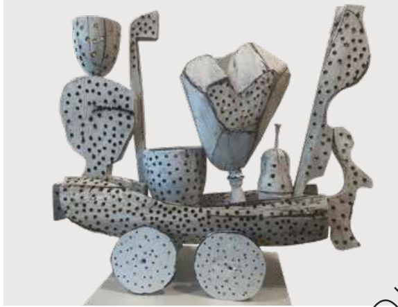
Lastenschiff auf Reisen (Cargo Ship traveling) Holz, weiß gefasst (Wood, set in white) 58 x 46 x 16 cm | 2010 | 998 €