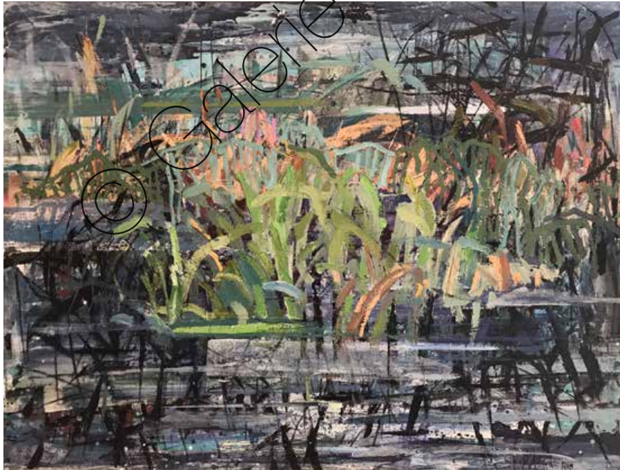
Frisches Grün (Fresh Green) Mischtechnik/Lw (Mixed media on canvas) | 150 x 202 cm | 2020 | 7.900 €