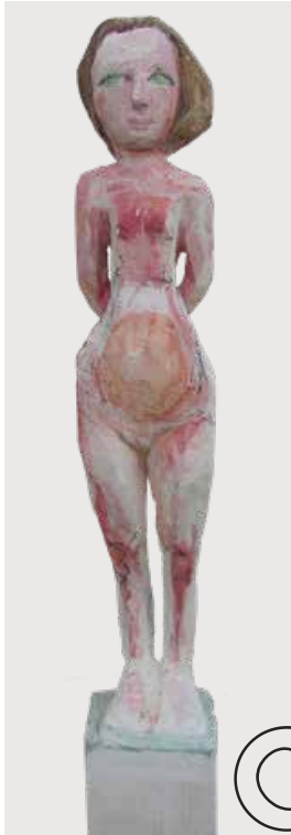
Kleine Weiße (Little White One) Holz, farbig gefasst (Wood, coloured) Höhe/height 150 cm 2017/18 | 1.600 €