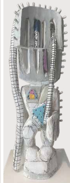
Kopplastig (Top-heavy) Holz, farbig gefasst (Wood, coloured) 70 x 27 x 19 cm 2023 | 998 €